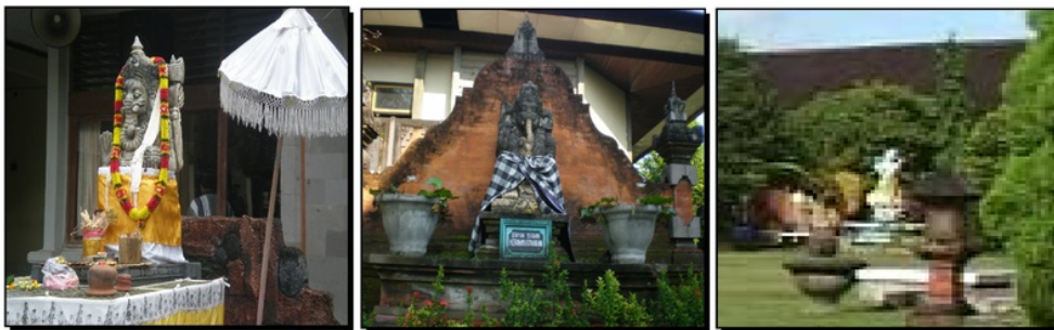
a. Ganesha SMKN 1 Singaraja b. Ganesha SMKN 3 Denpasar c. Saraswati SMKN 3 Denpasar