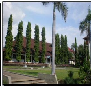
c. SMKN 3