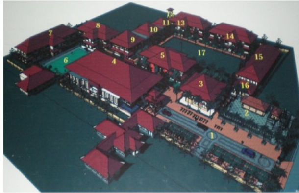
a. Pola Mandala