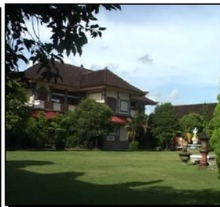
b. SMKN 3 Denpasar