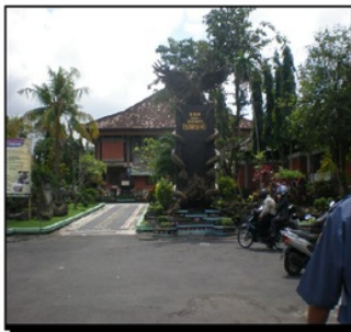
a. SMKN1 Gianyar Singaraja

Dewi Saraswati adalah simbol peraih ilmu pengetahuan. Sasaswati digambarkan sebagai Dewi cantik bertangan empat memegang simbol-simbol ilmu pengetahuan. Gambar 6 menunjukkan pola tanaman perdu dan taman SMK model Indigenous Wisdom THK di SMKN 1 Gianyar, SMKN 3 Denpasar, dan SMKN 3 Singaraja. Sedangkan Gambar 7 menunjukkan model patung Dewi Saraswati dan Patung Ganesha yang dipasang di halaman sekolah SMKN 1 Singaraja, SMKN 3 Denpasar, dan Patung Sawaswati yang dipasang di halaman SMKN 3 Denpasar.