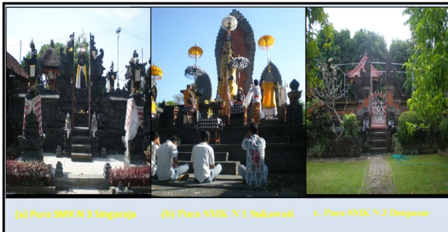
Gambar 3. Parhyangan Pura Sekolah SMK Model Indigenous Wisdom THK

Utamaning utama dan utamaning madya adalah zone atau mandala tempat dibangunnya Pura Sekolah sebagai Parhyangan . Pura sekolah merupakan tempat dimana pada peserta didik, guru, tenaga kependidikan memuja dan mengagungkan Tuhan. Bangunan pokok dari Pura Sekolah terdiri dari bangunan Padmasana sebagai stana Tuhan Ida Sang Hyang Widhi Wasa. Di Pura Sekolah dilakukan pemujaan Tuhan Ida sang Hyang Widhi Wasa. Dapat dipastikan bahwa pura sekolah (Gambar 3) merupakan ciri pokok SMK model Indigenous Wisdom THK.